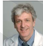
Prof. Dr. med. Miklos Pless Winterthur

Inzwischen ist etabliert, dass Patienten mit NSCLC im Stadium II und III multimodal behandelt werden sollten. Die adjuvante Chemotherapie mit einer Cisplatin-haltigen Kombinations-Chemotherapie bewirkt einen signifikanten Überlebensvorteil: Eine Meta-Analyse der wichtigsten 5 Studien mit 4584 Patienten ergab eine hazard ratio (HR) für das Gesamtüberleben von 0.83 zu Gunsten der adjuvanten Chemotherapie beim Stadium II und III, die beste Chemotherapie-Kombination war Cisplatin/Vinorelbine (HR 0.80) [4]. Gibt es denn noch Gründe für eine neoadjuvante Therapie?