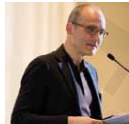
Pr E. Seifritz

En cas de dépression légère après la formation initiale ou la psychoéducation, les recommandations thérapeutiques suisses prévoient une phase d'observation relativement courte (deux semaines), appe-