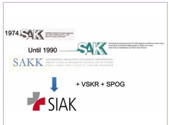
Abb. 3: Logo und Name änderten über die Zeit, die SAKK blieb