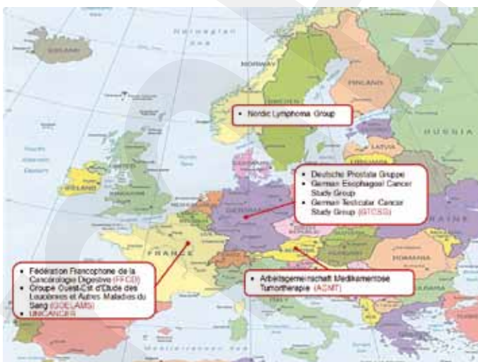
Abb. 1: Zusammenarbeit mit anderen Gruppen für Studien der SAKK

Die SAKK ist das einzige nationale Netzwerk für Krebsforschung in der Schweiz. Der Wettbewerb findet vor allem im internationalen Bereich statt. Dabei gilt es zu berücksichtigen, dass es die Schweiz im internationalen Umfeld schwer hat. Durch die relativ kleine Population und die dezentrale Organisation entstehen relative Nachteile. Diese können durch die hohe Expertise und die gute Infrastruktur teils kompensiert werden. Auf der anderen Seite nimmt