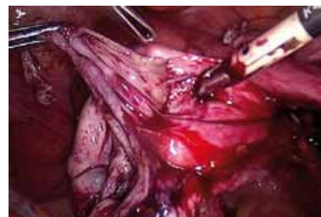
Abb. 5: Das Kapselstripping bei Endometriomen muss mit maximaler Sorgfalt erfolgen. Trotzdem lässt sich ein gewisser Oozytenverlust nicht vermeiden