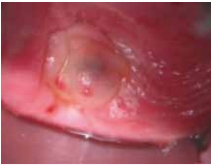
Abb 1: Endometrioseherd in der hinteren Fornix