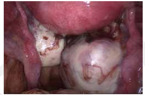
Abb. 3: : Operationssitus von Kissing ovaries. Sie sind häufig mit weiteren schweren Formen der Endometriose vergesellschaftet (Beispiel Abb. 4)