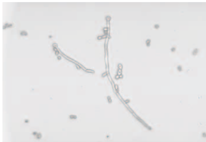
Abb. 1: Candida albicans

Typische Symptome sind Juckreiz, Brennen, Rötung, Dyspareunie, Dysurie und Ausfluss. Jedoch leiden nur 35–40% der Frauen mit vulvovaginalem Pruritus tatsächlich an einer Kandidose. Die Symptome erlauben also nicht verlässlich zwischen den Ursachen